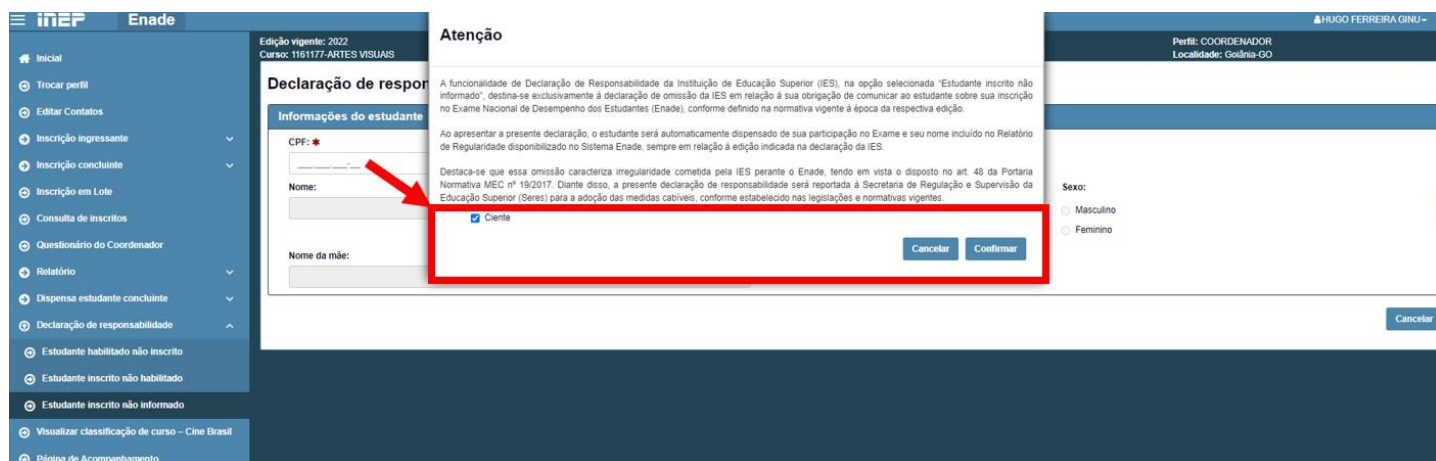
Figura 6: Tela do sistema Enade - Atestar Ciência Estudante Inscrito não Informado

Ao ser selecionado a opção “Estudante Inscrito não Informado” aparecerá em tela uma mensagem com a descrição do objetivo da ação e solicitando a ciência do coordenador do curso, conforme Figura 6.