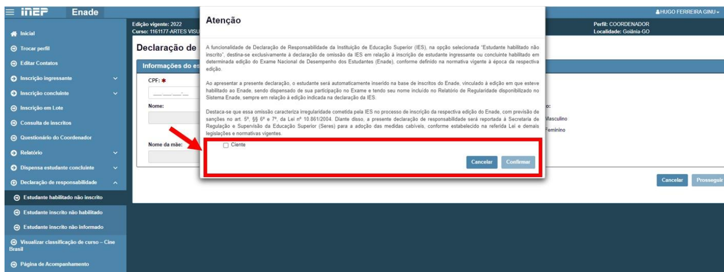
Figura 2: Tela do sistema Enade - Relatório de Regularidade

Ao ser selecionado a opção “Estudante habilitado não inscrito” aparecerá em tela uma mensagem com a descrição do objetivo da ação e solicitando a ciência do coordenador do curso, conforme Figura 2.